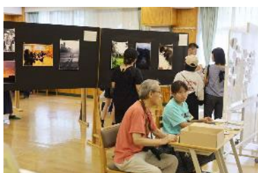
受付をしている生徒 & 部活動指導員の先生⇒

2日間で 500 人を超える人に見に来ていただき、各部員の写真に対するコメントも多数書いていただきました。ご来場くださった皆さま、どうもありがとうございました。