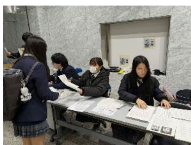
受付のお手伝いをしています

また、夏の大会と冬の大会の優秀作品の中で上位 10 作品に与えられる全国大会への推薦は叶いませんでしたが、上位11位～30位に与えられる関東大会(関東地区高等学校写真展)に2名の生徒が推薦されることになりました(来年2/2～2/7、中野区にある東京工芸大学の中野キャンパス6号館にて2名の写真が展示されます)。