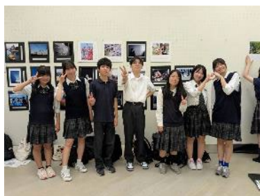
展示した作品と一緒に