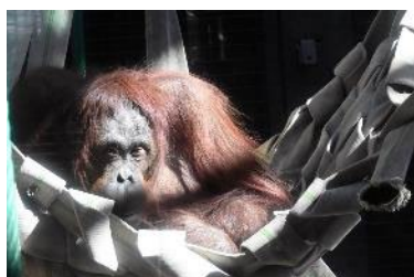
最優秀賞 光の中の愁い