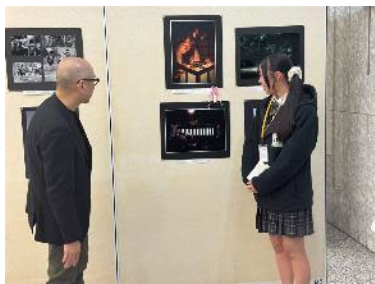
写真家「熊切大輔」先生から自分の作品の講評を受けている様子