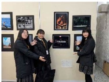
無事に貼り終わりました！