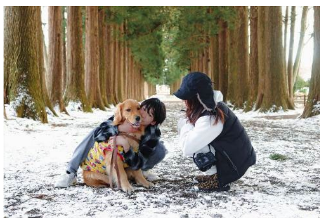
わたしのあたたかい家族