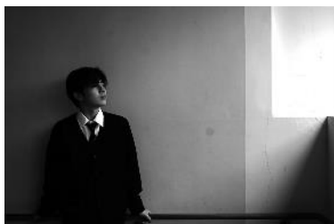
優秀賞 未来への憂い