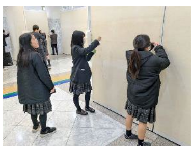
写真を貼る準備中