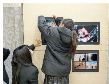
協力しながら作品を貼っています