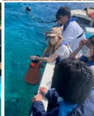
パノラマボートツアー