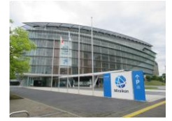
日本科学未来館外観