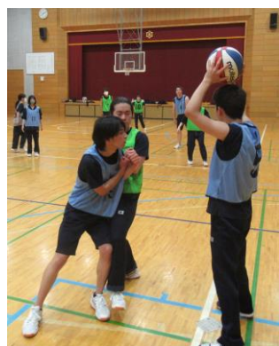
バスケットボール

令和4年6月17日(金)に令和4年度第1回球技大会が行われました。本番当日までに何度も体育委員が集まり種目やルール、役割等について話し合いを重ねました。今回は各年次の人数に差があることから、全年次を縦割りに3チームに分けた上で「バスケットボール」と「卓球」を行いました。年次縦割りの即席のチームでも、体育の授業で練習してきた成果を、どのチームもここぞとばかりに発揮していました。素晴らしかったです。次回も定時制全体で楽しく盛り上がりたいですね。体育委員の皆さん、準備から当日の運営まで本当にお疲れさまでした。皆さんの活躍に感謝しています。