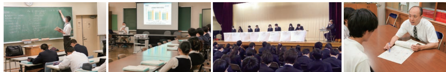
公務員受験指導 就職講演会 卒業生進路体験談 進路指導風景