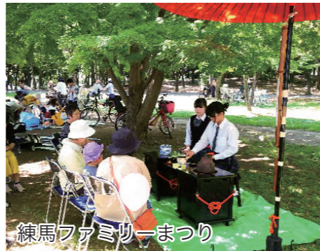
練馬ファミリーまつり