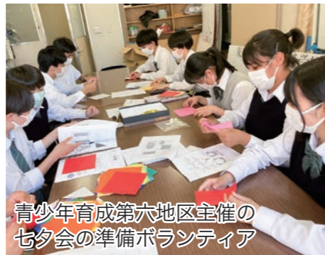
青少年育成第六地区主催の七夕会の準備ボランティア