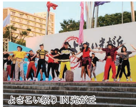
よきこい祭り IN 光が丘