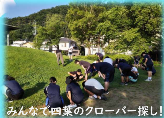
みんなで四葉のクローバー探し!