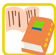
推薦図書・参考書