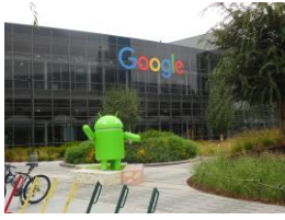
いくつものビルが点在する Google

シリコンバレーは、サンノゼ市及びサンフランシスコのベイエリア一体に広がっており多くの企業が集まっています。