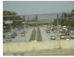
サニーバールと高速道