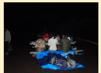
マウナケア山オニヅカセンター ……満点の星空、天の川……