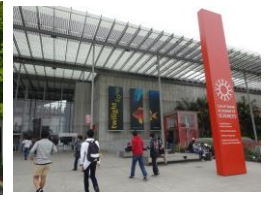
California Academy of Sciences