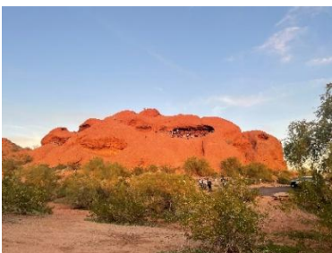
↓ Hole in the Rock