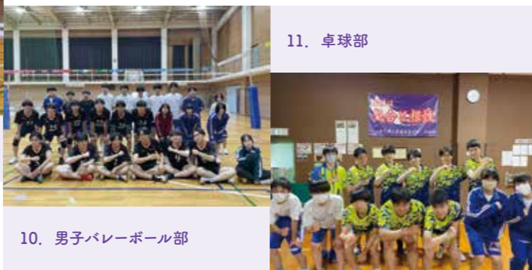
10. 男子バレーボール部