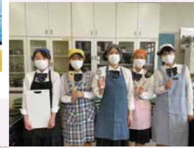
5. ホームメイキング部