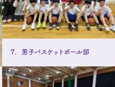
7. 男子バスケットボール部