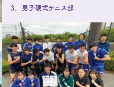
3. 男子硬式テニス部