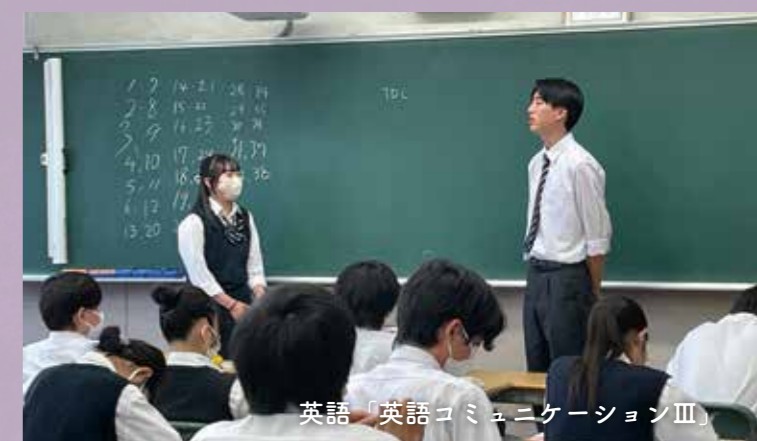
英語「英語コミュニケーションⅢ」