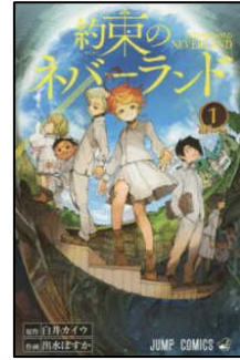
『約束のネバーランド』 白井カイウ作 出水ぽすか作画

地味な谷くんと派手な鈴木さん。二人とも自分ないものを持っている相手に惹かれ、付き合い始めます。お互いを理解しようとする純粋な気持ちで向き合う姿がとっても可愛いです。