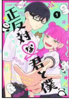
『正対な君と僕』 阿賀沢紅茶作

高校3年生の進路に悩む時期に出会った3人の男女の物語。心理描写が見事と漫画ファンの評判も高く、胸キュンキュン間違いなしの青春純愛物語です。