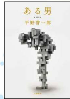
『ある男』 平野啓一郎著

主人公は様々な科を回っている研修医。彼は患者たちが抱える問題に耳を傾け、解決の糸口をさがしていきます。こんなお医者さんにかかりたいなあと思う医療ミステリーです。