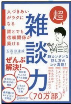
『超雑談力』 五百田達成著

舞台の孤児院ではたくさんの子供たちが仲良く暮らし、いずれは里親へ送り出される約束でしたが、、その約束が守られないとんでもない農園でした。さてどんな展開になるでしょう！