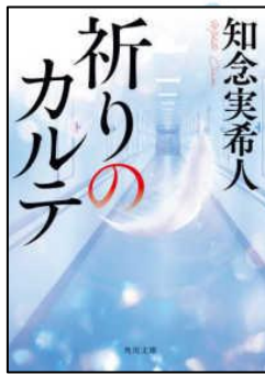
『祈りのカルテ』 知念実希人著

雑談って大切ですよね。お互いに居心地良い雑談のためのちょっとしたコツが書かれています。それには肯定と共感が大切です。気の利いた相槌でなくても「あー」とか「おー」でもいいそうです。