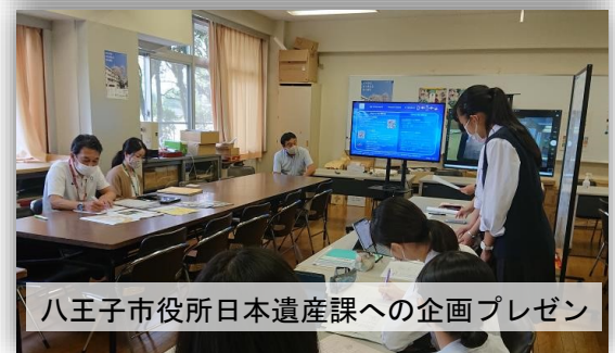
八王子市役所日本遺産課への企画プレゼン