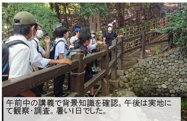
午前中の講義で背景知識を確認。午後は実地にて観察・調査。暑い日でした。

地歴公民科では地理・歴史の分野にまたがり、定期的にフィールドワークを行っています。今回のテーマは「国分寺・府中の地形と歴史」。多摩川の作った河岸段丘を観察しながら、国分寺や府中(武蔵国府)といった古代武蔵国の中枢が、なぜここに建設されたのか考察しました。タブレットも活用して地図や今昔の景観写真などとの比較を行いフィールドワークの方法も身につけました。是非次回も応募して下さい。