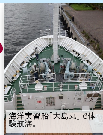
海洋実習船「大島丸」で体験航海。