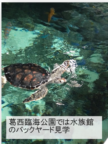
葛西臨海公園では水族館のバックヤード見学

東京都の水産資源に関する教育活動で、葛西臨海公園で講義や見学、大島国際海洋高校の大島丸で海洋高校に関する説明や実際に出航する様子を見学しました。この活動の中で、水族園では世界中で漁獲されたマグロの8割が日本で消費されていること、絶滅が危惧されているマグロの資源管理に取り組み完全養殖の技術の向上が進められていることを学びました。他にも、大島丸での見学活動で浴槽を深くして水の使用量を減らしていることなど、限られた資源の中で航海をする工夫が印象的でした。