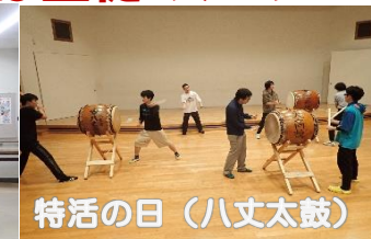
特活の日（八丈太鼓）