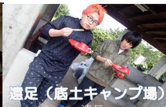
遠足（底土キャンプ場）