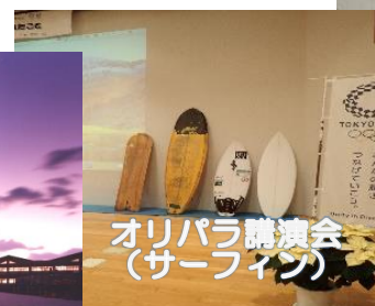
オリパラ講演会 （サーフィン）