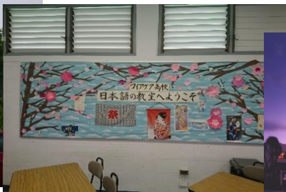
Waiakea高校の日本語教室