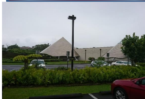
ハワイ大学ヒロ校プラネタリウム及び カフェテリア棟