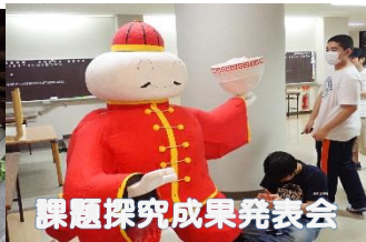
課題探究成果発表会