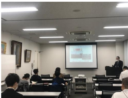
【学校長挨拶の様子】