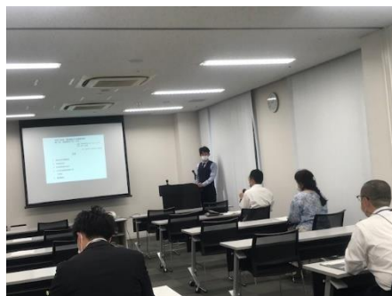
【全日制課程紹介の様子】