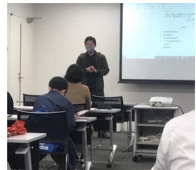
【八丈町企画財政課より】