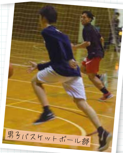
男子バスケットボール部