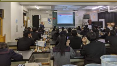
サイトカインとは