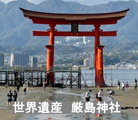
世界遺産 厳島神社