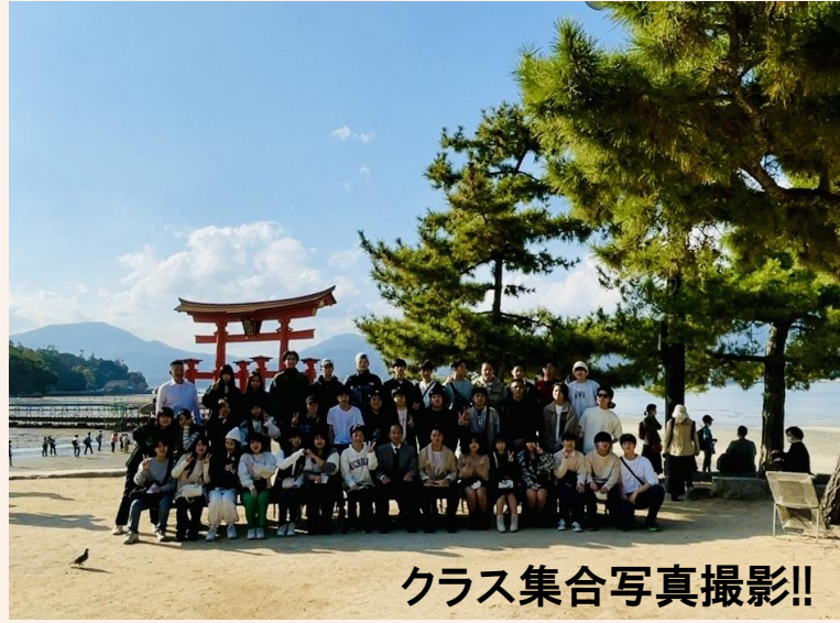
クラス集合写真撮影!!