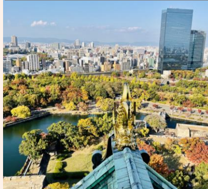
大阪城 天守閣の眺望

令和4(2022)年11月7日(月)から10日(木)(3泊4日) 本年度の修学旅行コース: 広島、神戸、大阪方面 2年生は広島、神戸および大阪方面に行ってきました。1日目の広島では、世界遺産の宮島、厳島神社、平和記念資料館や原爆ドームなどで歴史や文化、平和への志向性を高めました。2日目の神戸では、港町神戸の歴史と文化、阪神淡路大震災の遺構などから震災について理解を深める活動ができました。最後の2日間は、大阪の今に触れると共に、歴史や文化を体験を通して、学ぶことができました。