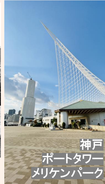
神戸 ポートタワー メリケンパーク