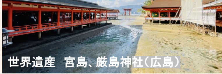
世界遺産 宮島、厳島神社(広島)