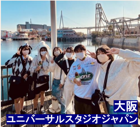
大阪 ユニバーサルスタジオジャパン