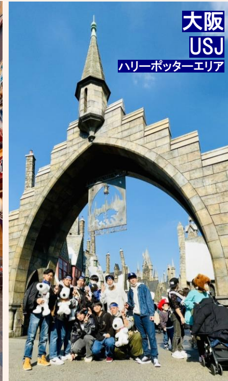
大阪 USJ ハリーポッターエリア