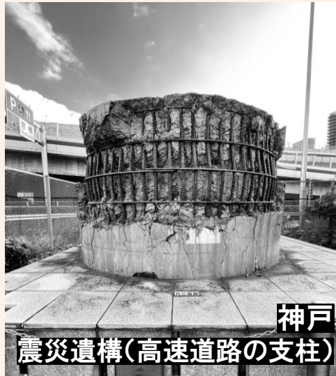
神戸 震災遺構(高速道路の支柱)