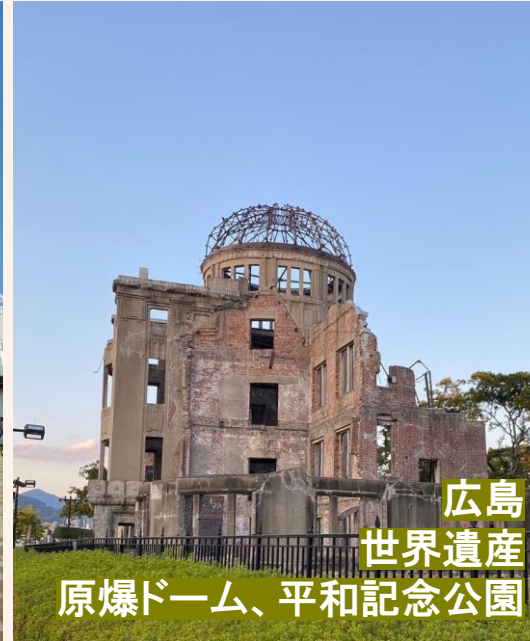
広島 世界遺産 原爆ドーム、平和記念公園