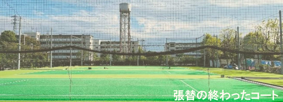
張替の終わったコート