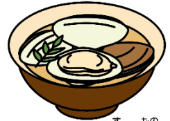
はまぐりのお吸い物

になったのは江戸時代のことで、もとは人形を身代わりにして邪気をはらう「流しびな」が起源とされます。行事食として、ちらしずし、はまぐりのお吸い物、ひしもち、ひなあられなど、華やかな食べ物が並びます。