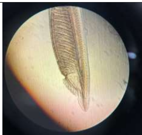
5月6日 原索動物ナメクジウオの観察