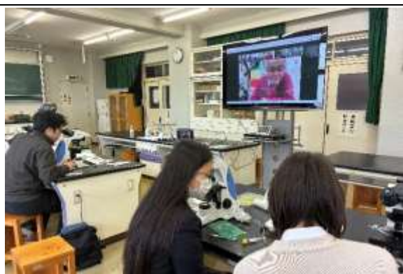
5月6日 実験講義の様子

今回の経験を通して、自身の興味・疑問も含めて、学問を探究することは面白いことであると気づいてもらえると嬉しいです。身近な生物など、科学は日常生活のあらゆるところに存在しています。授業で学んだこととのつながりを見つけて、今後の実習や探究で理解を深め、学習に対する意欲の向上に生かされていくことを期待しています。今回、受精させたヒトデの個体がどこまで成長できるか、生徒からは継続して育てていきたいという声もあがり、楽しみです。