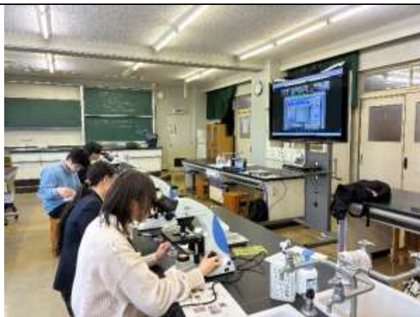
5月5日 顕微鏡観察の様子