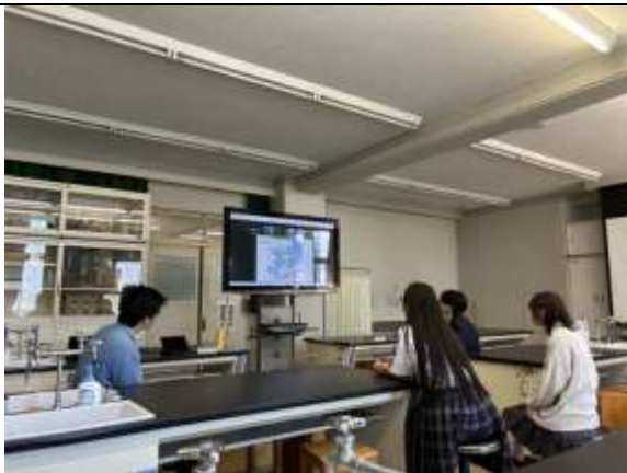
5月5日 講義を受ける様子

5月5日の午後には、千葉県館山の臨海施設から送付されたヒトデの卵巣から出た卵と精子を受精させました。極体が出てくる様子や受精膜があがる様子、2細胞期・4細胞期などの卵割が進んでいく様子を顕微鏡で実際に観察することができました。生物の教科書では、ウニやカエルの発生を学ぶところ、今回の実習ではヒトデの発生を観察するという、貴重な体験でした。ウニとヒトデの幼生も観察し、それらの相違点も学びました。