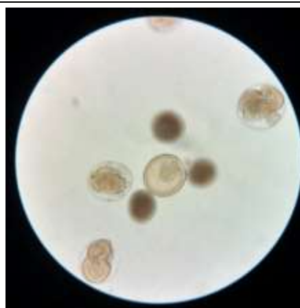
5月6日 ヒトデの原腸胚（中央）