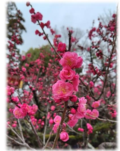
梅の花が咲いて、春はもうすぐそこ