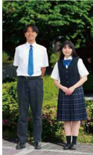
夏服 半袖スタイル