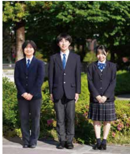
冬服 プレザースタイル