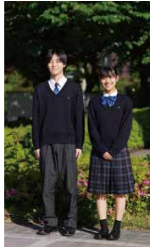
冬服 セータースタイル