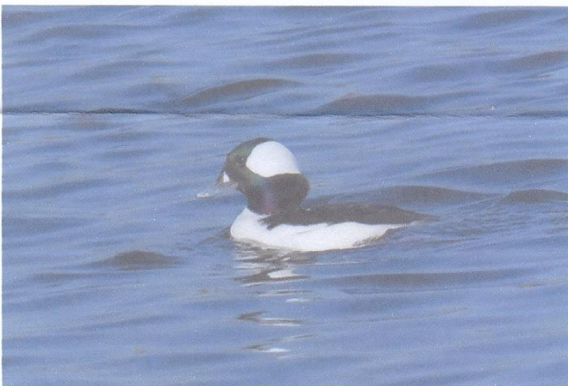
浅山 英樹氏 作品(ヒメハジロ)