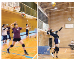
バレーボール部(男女)