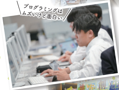
プログラミングはムズいけど面白い