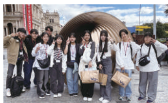
▲ブリスベン観光・クイーンズストリート