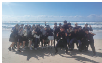
▲ゴールドコースト・サーファーズパラダイス