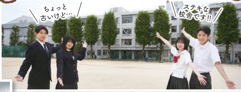
ちょっと古いけど...

土曜授業は年20回ほど、午前中4時間で行われます。その他、校内予備校なども実施します。