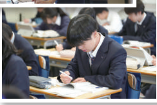
Great, thank you.