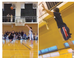
バスケットボール部(男女)