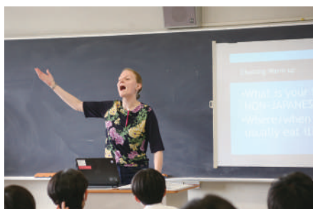
▲ALT(外国人の先生)からも学べる「英語」の授業