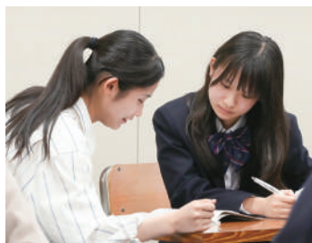
▲ サポートティーチャー

「自主自律、文武両道、文理両眼、グッドトライ」を目標とし、教科横断的な探究活動、大学や地域等と連携した理数教育、キャリア教育、国際理解教育といった教育活動を通じて、自己実現に向け主体的に努力し、他者と協働しながら飽くなき挑戦を続け、社会に新しい価値を提言できる生徒を育成する。