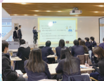
▲ 日本大学文理学部での調布北高校生の発表