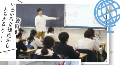
資料をいろいろな視点からとらえること...