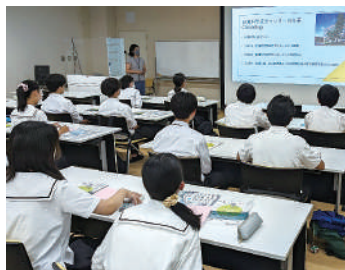
▲ 筑波大学での研究室訪問