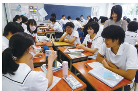
▲ピブリオバトル・クラス予選

※4 ( )内の数字は単位数。選択科目は開講されない場合や変更となる場合もあります。