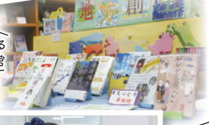
ワクワクする図書館