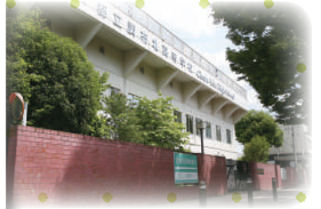
体育の授業も熱い!