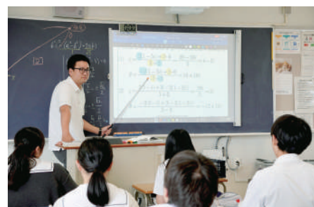
▲1・2年生の数学と英語は習熟度別授業