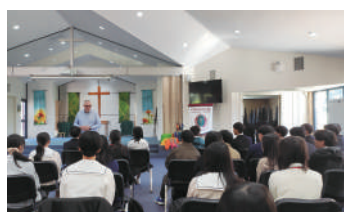
▲チザムカソリックカレッジ・キャンパスツアー