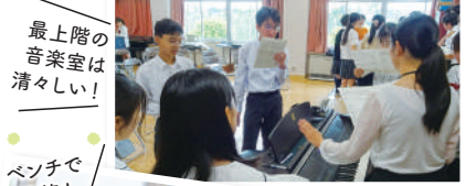
最上階の音楽室は清々しい!