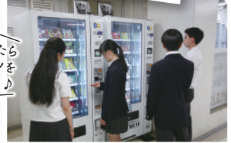
小腹がすいたら自販機でオヤツをゲット!