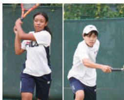
硬式テニス部(男女)