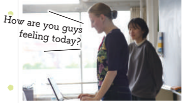
How are you guys feeling today?