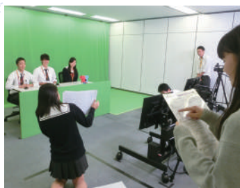
▲ TGG (Tokyo Global Gateway) での体験的学習