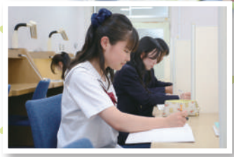
個別ブーイスの自習室で明日の予習!