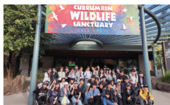
▲ゴールドコースト・カランピン動物園