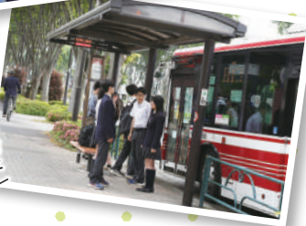
学校の目の前に徒歩7歩バス停