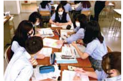
グループワークの授業

国立ベトナム国際大学内において、現地起業家および大学教授をファシリテーターとしたPBL(Project Based Learning)型によるビジネス研修を実施します。PBLとは、少人数グループによる問題発見解決型(事例解決型、事業課題解決型)の学習方法であり、与えられたミッションに対して、現地大学生と英語による実践的なコミュニケーションを取りながら、協働・協力しあい、市場調査からプレゼンテーションに至る一連のマーケティング活動をチームで実践する内容となっています。