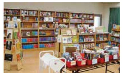
英語書籍(イングリッシュルーム)