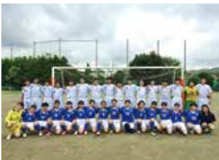
女子サッカー部・男子サッカー部