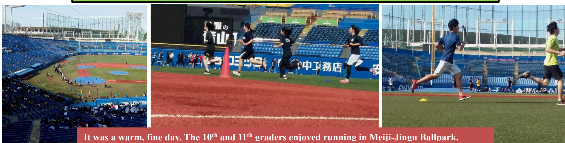
It was a warm, fine day. The 10 th and 11 th graders enjoyed running in Meiji-Jingu Ballpark.