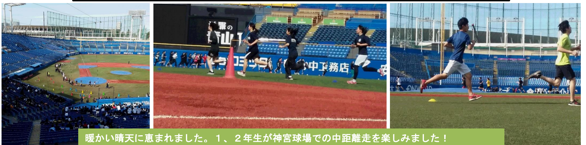
暖かい晴天に恵まれました。1、2年生が神宮球場での中距離走を楽しみました！