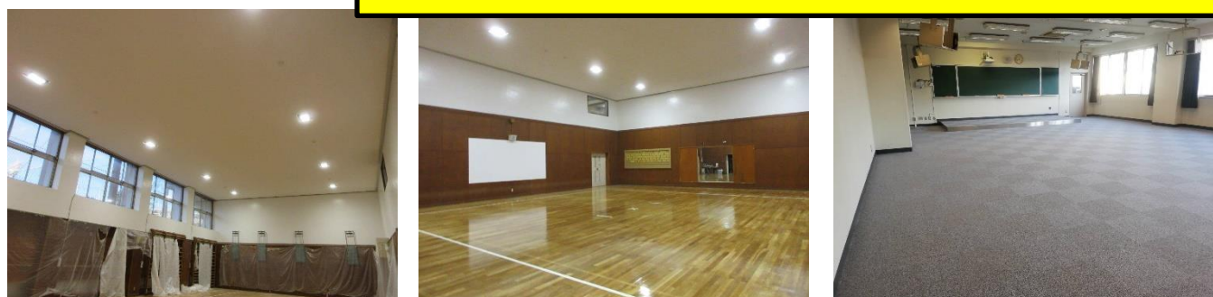
Left: new ceiling of the training room Middle: new ceiling and wall of the kendo room Right: new carpet of the special classroom #2

We will continue making efforts in order to improve the school facilities for our students. Please feel free to give us whatever good suggestions you have at any time.