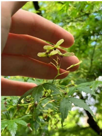
イロハモミジの花と果実 (プロペラ形です)