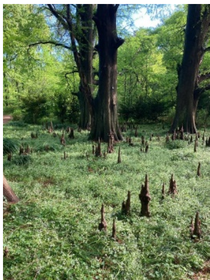
有名なラクウショウの気根