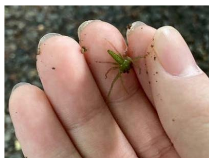
ハナグモもいました