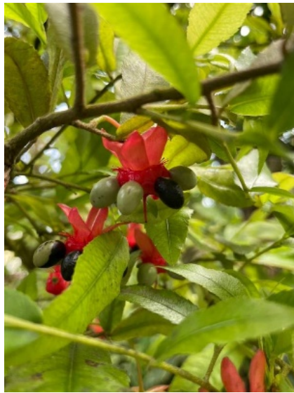
ミッキーマウスの木