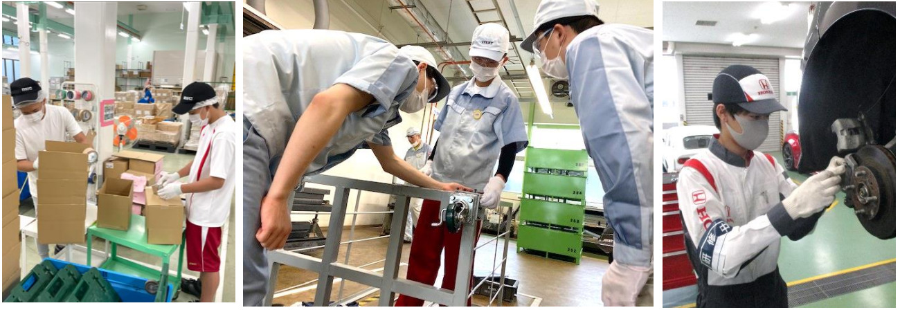
工場では、生産ラインに立って作業したり、作業着やユニフォームをお借りしての体験でした