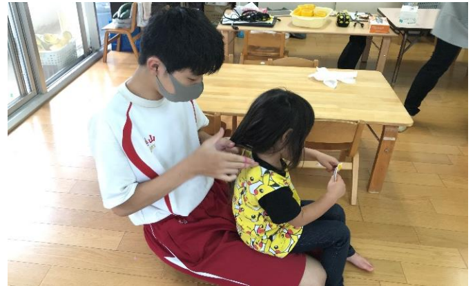
保育園では、保育士の仕事として園児のお世話・おやつ準備・砂場での監督などを体験