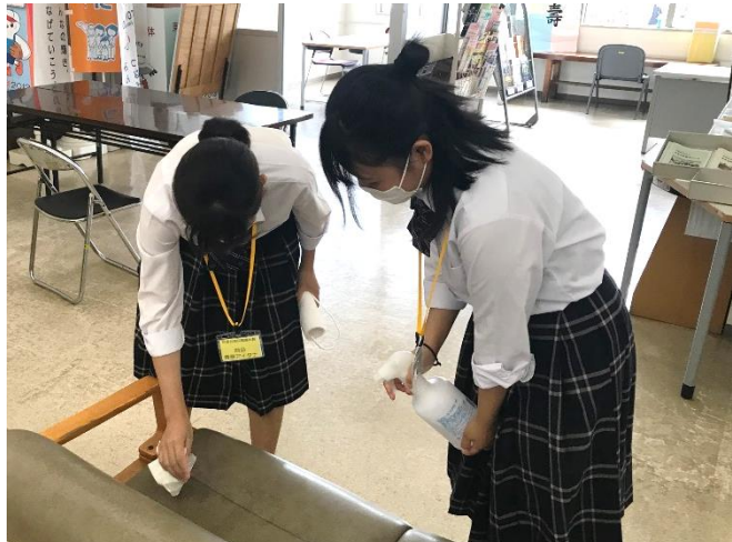
その他、スーパーや動物園、公民館、ゴルフ場、農場など、様々な業種のお仕事を体験しました