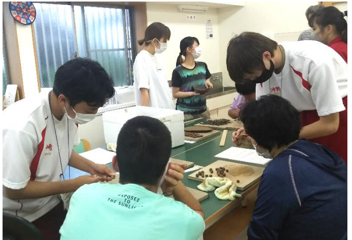
特別養護老人ホームでは、利用者の方とお話・配膳準備・おやつ作り・レクレーションの準備、 また、感染防止のための共有スペースの消毒などを体験しました