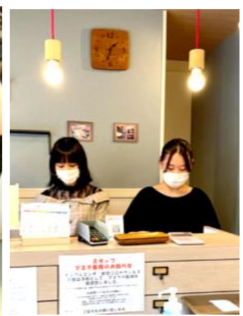
美容室やマッサージ店では、お店の掃除・受付の準備・タオルの準備など、裏方の仕事も。