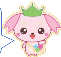
公式マスコットキャラクター さくらん

※イベントのお申し込みについては、開催日の約3週間前より本校ホームページからLOGOフォームにて受け付けます。SNS等で、本校の教育活動についても報告しておりますので、そちらも御覧ください。皆様の御参加をお待ちしております！