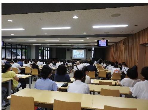
全体概要説明(視聴覚室にて)

来場者からは「とてもしつかり説明してもらい、江北高校のことがよく分かり、有難かったです」など、大変好評でした。