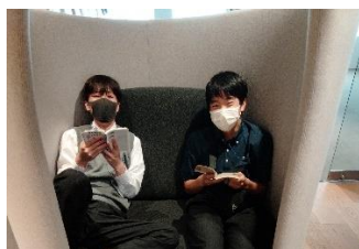
文学館内での読書

〈図書委員会からのお知らせ〉 夏季休業中は、一人最大20冊まで図書室から本を貸し出します。ぜひたくさん借りて「読書の夏」として下さい。